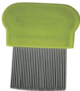
Metalen netenkam= behandel kam